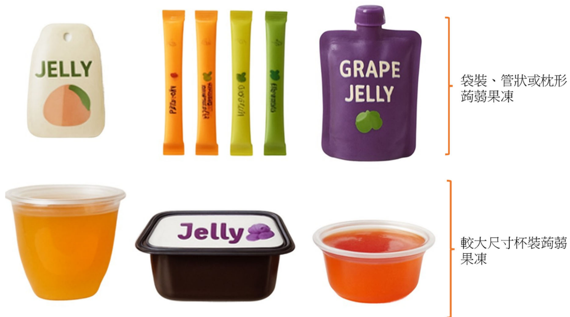
圖 2：非迷你杯裝蒟蒻果凍產品的例子。