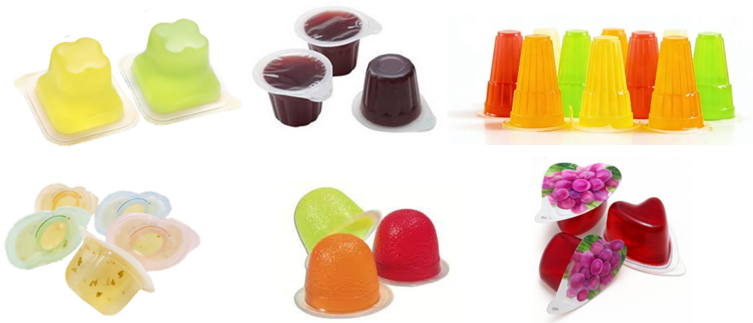
圖 1：迷你杯裝蒟蒻果凍產品的例子。

2.2 迷你杯是一種容器，可盛載擬以一口吞食方式(例如：透過擠壓迷你杯，將果凍推出至口中)食用的果凍。圖 1 和圖 2 分別展示迷你杯裝和非迷你杯裝蒟蒻果凍的示例。