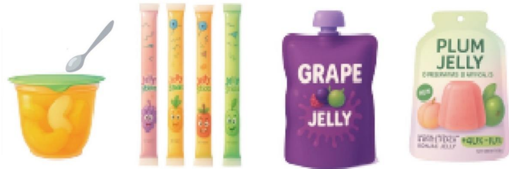
圖 3：不受《修訂規例》的成分要求規管的蒟蒻果凍產品例子

2.3 這項成分要求及相關禁止銷售規定不適用於含蒟蒻成分的非迷你杯裝果凍(例如袋裝、管狀或枕形果凍)，以及需使用餐具食用的果凍。不過，這些產品須符合《修訂規例》附表 2 訂明的特定標籤規定。