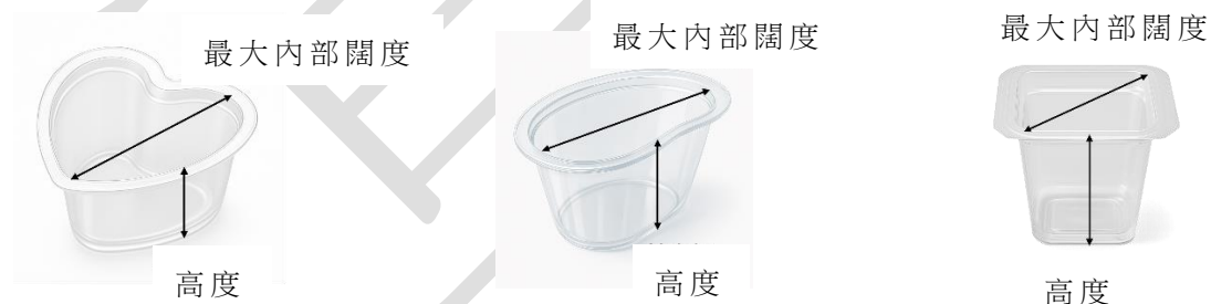
圖 2：展示如何量度非圓口迷你杯的示意圖。最大內部闊度指杯口一側內壁至對面內壁的最長距離。