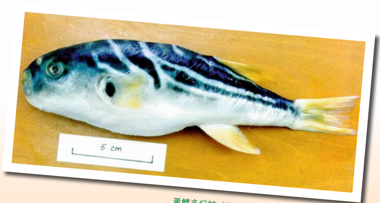
黃鰭多紀魷 (拉丁學名: Takifugu xanthopterus )