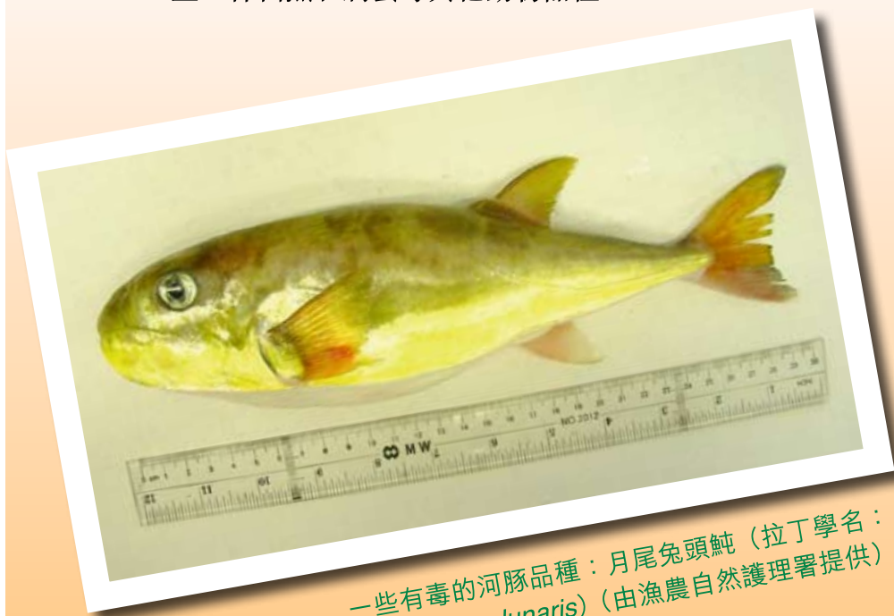
一些有毒的河豚品種：月尾兔頭魷（拉丁學名： Lagocephalus lunaris ）

河豚毒素是一種毒性強烈的海洋生物神經毒素。河豚，俗稱雞泡魚（見插圖）和刺規是含河豚毒素的魷形目常見魚類。除此之外，河豚毒素亦會存在於鰕虎魚、貝類海產、加州蠓螈、鸚哥魚、斑蟊屬蛙類、藍紋章魚、海星、神仙魚和扁蟹等其他動物品種。