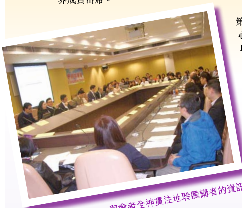
與會者全神貫注地聆聽講者的資訊

二月二十三日舉行的第三十三次論壇，中心首先報告小量豁免申請的工作進度。中心及業界亦討論「《危險藥物條例》- 有關“ \gamma -丁內酯”〔Gamma-butyrolactone〕的管制」、「製備可閱的食物標籤業界指引」的最新進展及「預先包裝食物的營養及健康聲稱」的議題。最後，是簡介《即食食品微生物指引》的修訂及其技術會議，鼓勵業界成員出席。