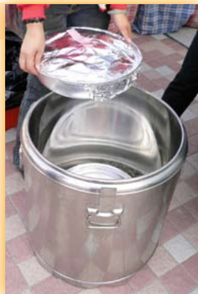
運送盤菜時，必須保持食物 於攝氏60度或以上。

答案：1 - F. 信譽良好 2 - E. 攝氏60度以上 3 - I. 攝氏4度或以下 4 - H. 《食物內防腐劑規例》 5 - C. 攝氏75度