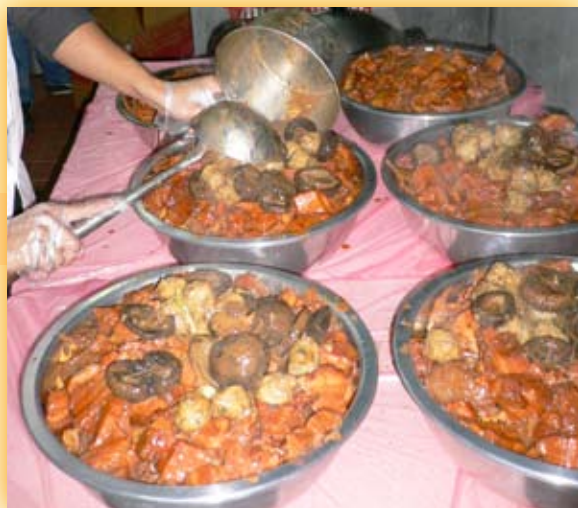
製作好的盤菜，應盡快分份， 避免食物受到污染。