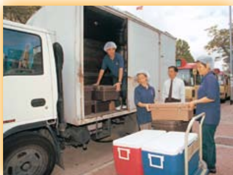
運送食物的車輛必須保持清潔。