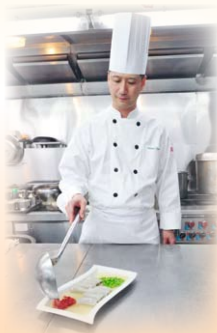
高師傅親自示範「艷影紗窗」

八月軒自2009起連續三年簽署「食物安全『誠』諾」，肩負起承諾人的使命，與政府攜手合作，向社會各界推廣食物安全。