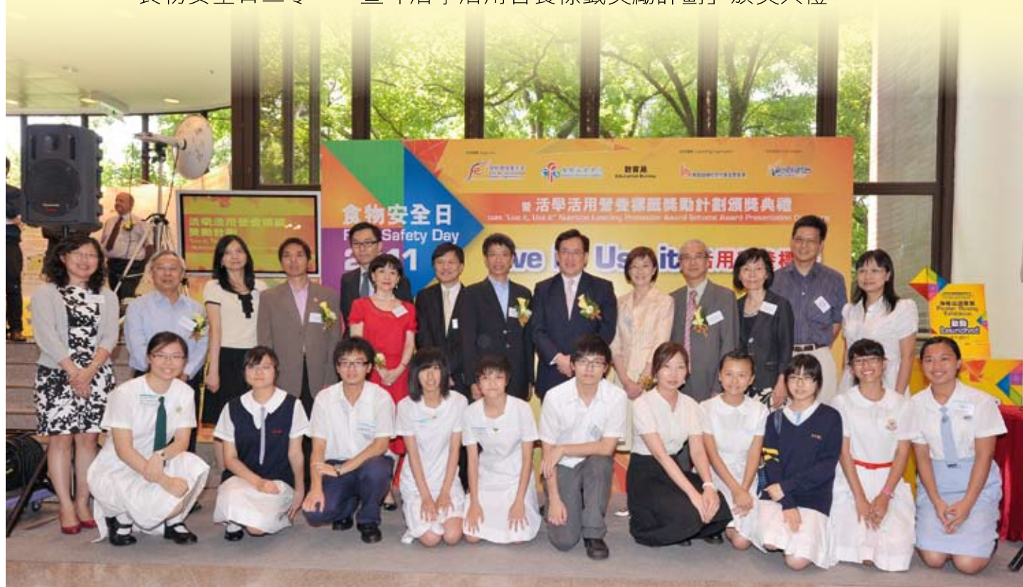
主禮嘉賓與部份參賽隊伍於會場內留影

為了表揚所有參與的同學的無比創意和努力，中心於七月八日聯同教育局合辦了食物安全日二零一一年暨「活學活用營養標籤獎勵計劃」頒獎典禮。