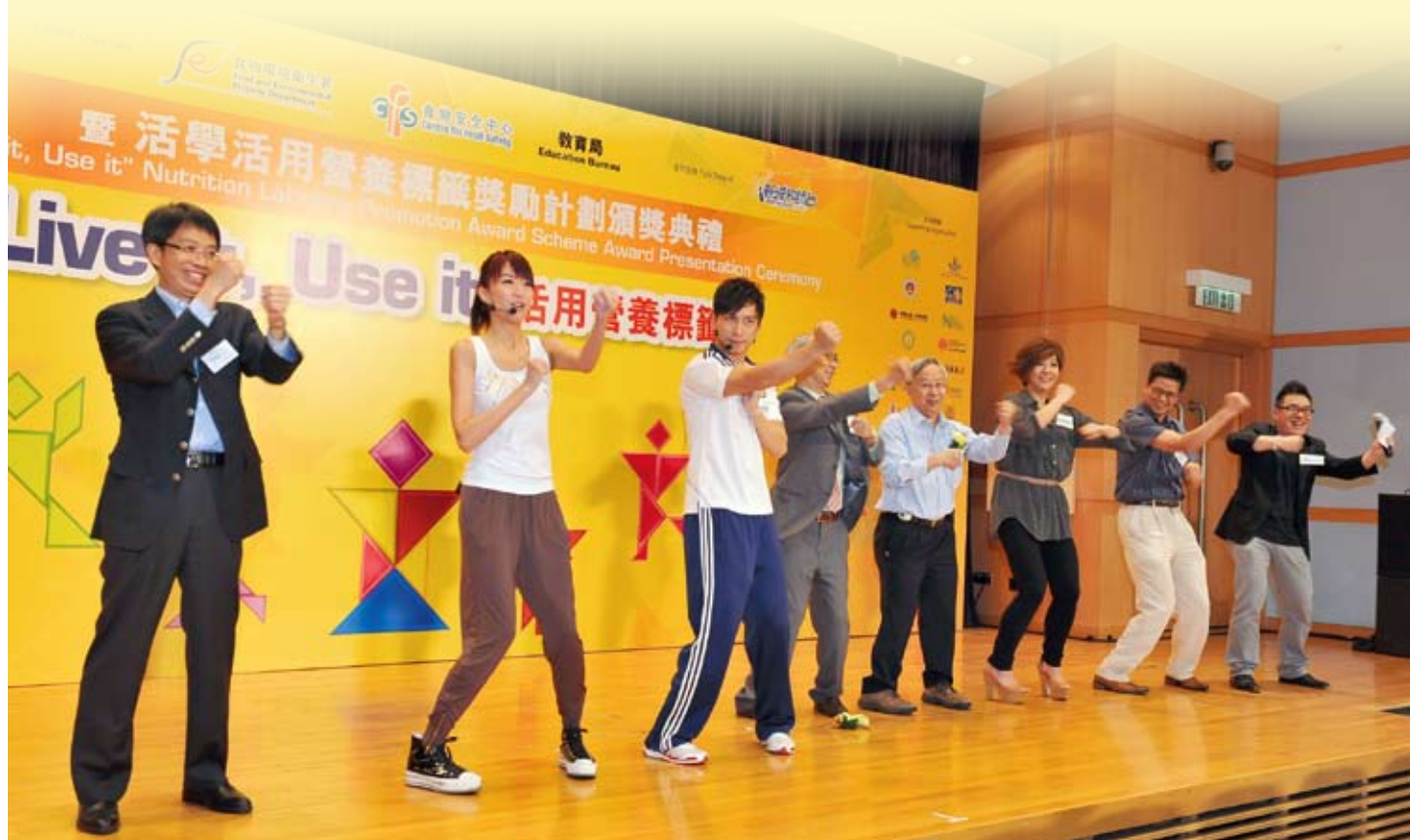
梁署長及眾嘉賓帶領全場人士一同耍詠春

活動最後的環節是全場人士一同配合中心宣傳營養標籤的主題「營養知多少，揀啱我需要」耍詠春，喻意學懂看營養標籤，就如練習詠春，對個人的健康有莫大裨益。