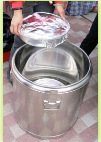
運送盤菜時，必須保持食物於攝氏60度或以上。