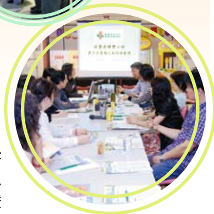
小組成員於專題小組討論會議踴躍發表意見。