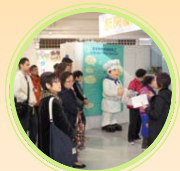
小組成員參觀衛生教育展覽及資料中心的展覽廳。

有興趣參加的人士請填妥報名回條並於二零一二年七月三十一日或之前，傳真或郵寄至食物安全中心，亦歡迎瀏覽食物安全中心網頁 http://www.cfs.gov.hk/tc_chi/committee/committee_clg.html ，下載報名表格。成員名額有限，先到先得。如欲查詢，請致電食物安全中心（2867 5149）。