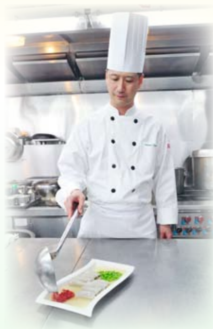
高師傅親自示範「艷影紗窗」

八月軒自2009起連續三年簽署「食物安全『誠』諾」，肩負起承諾人的使命，與政府攜手合作，向社會各界推廣食物安全。