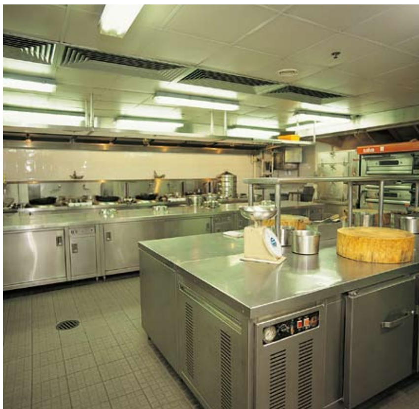
分開處理食物和清洗器皿用具的地方可減少交叉污染