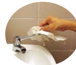
6. 用抹手紙包裹着水龍頭來關掉水源