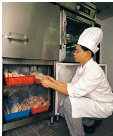
善用雪櫃，可保食物新鮮衛生