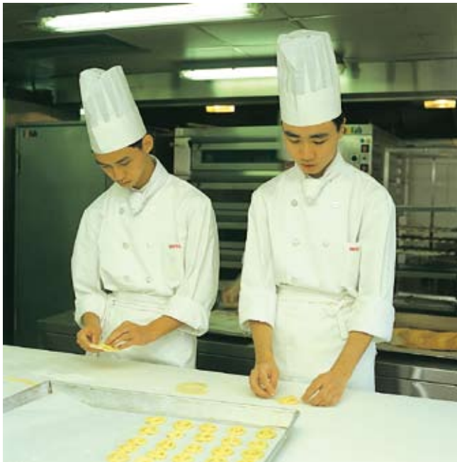
員工須穿着清潔制服及衣帽