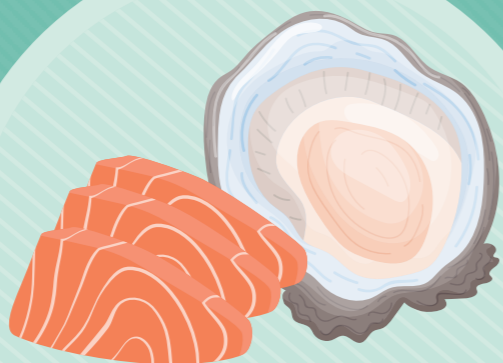
Makanan laut mentah dan diasapkan Raw and cold smoked seafood