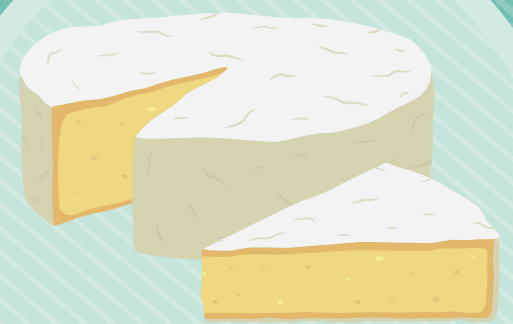
Keju dari susu mentah Raw milk cheese