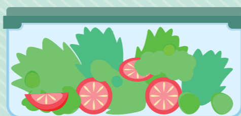
Salad hijau kemasan Prepackaged salad greens