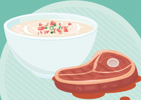
Daging dan jeroan mentah atau setengah matang Raw or undercooked meat and offal