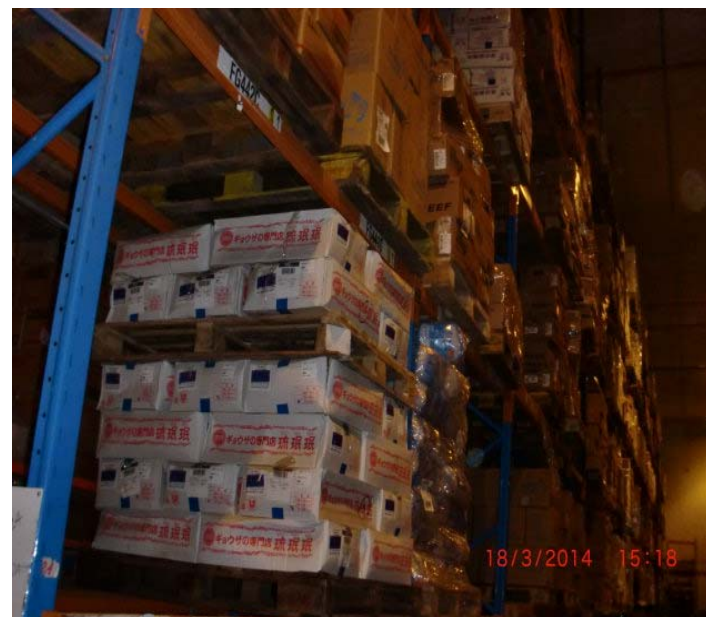
進口商倉庫 (適用於冷凍或冷藏食物)