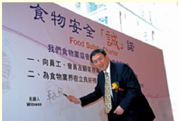
食物安全「誠」諾簽署儀式